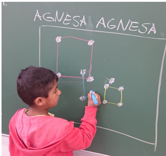
FIE školský klub